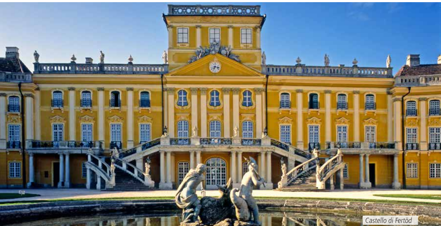
Castello di Fertöd

nedetina di origini antiche ma ricostruita agli inizi del Settecento in stile barocco. Nella cripta romanica è sepolto Re Andrea I, fondatore dell'edificio originale nel 1055. Proseguimento per Balatonfüred, principale centro di villeggiatura della riva settentrionale del lago, reso famoso dalle sue acque curative. Il più originale degli stabilimenti termali, in pieno stile Secessione, porta il nome dell'imperatrice Elisabetta. E' curioso poi vedere nei giardini pubblici le statue dedicate ai frequentatori più famosi di questa località tra cui spiccano i nomi di R. Tagore e del poeta italiano Salvatore Quasimodo. Nel tardo pomeriggio partenza per Budapest. All'arrivo sistemazione e cena in hotel. In serata possibilità di partecipare ad un tour della città illuminata (facoltativo e in supplemento) che, con i suoi monumenti e ponti magistralmente illuminati lungo il Danubio, offre uno spettacolo indimenticabile. Pernottamento in hotel.