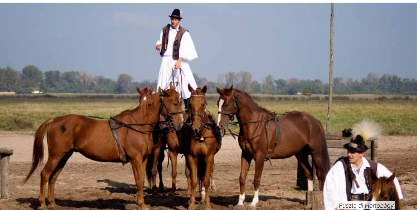
Puszta di Hortobágy

Prima colazione in hotel. Partenza per il Castello Grassalcovich a Gödöllő , località a breve distanza da Budapest, il preferito dall'imperatrice d'Austria e d'Ungheria Elisabetta. Pranzo libero. Proseguimento per Eger , città storica dell'Ungheria nord - orientale, immersa in un paesaggio di dolci colline coperte di vigneti, nel punto in cui la pianura incontra le catene dei monti Matra e Bükk. Famosa per il vino Sangue di Toro (Egri Bikavér), prodotto nei suoi dintorni, la città ha una storia millenaria, segnata dalla resistenza ai Turchi nel 1552. Visita guidata del centro storico con costruzioni barocche e rococò, il minareto