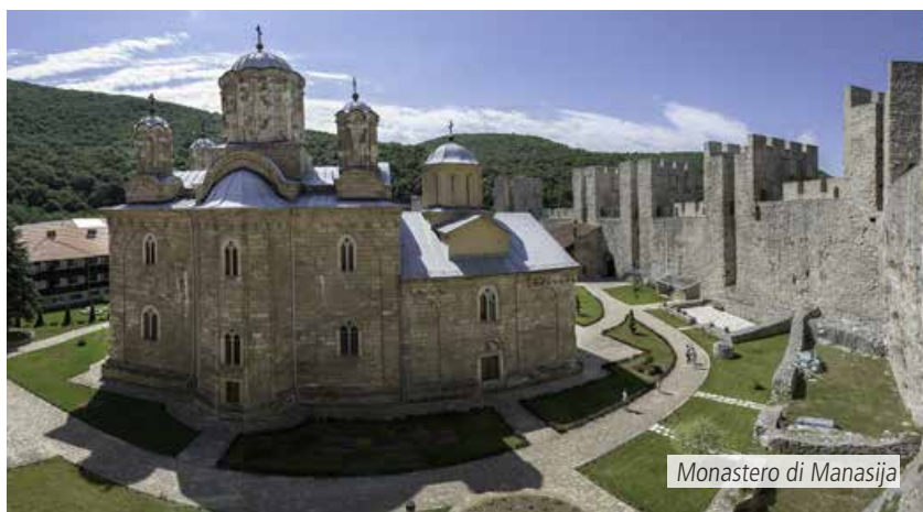
Monastero di Manasija

La tariffa verrà comunicata al momento della prenotazione in base alla disponibilità e alle promozioni in corso.