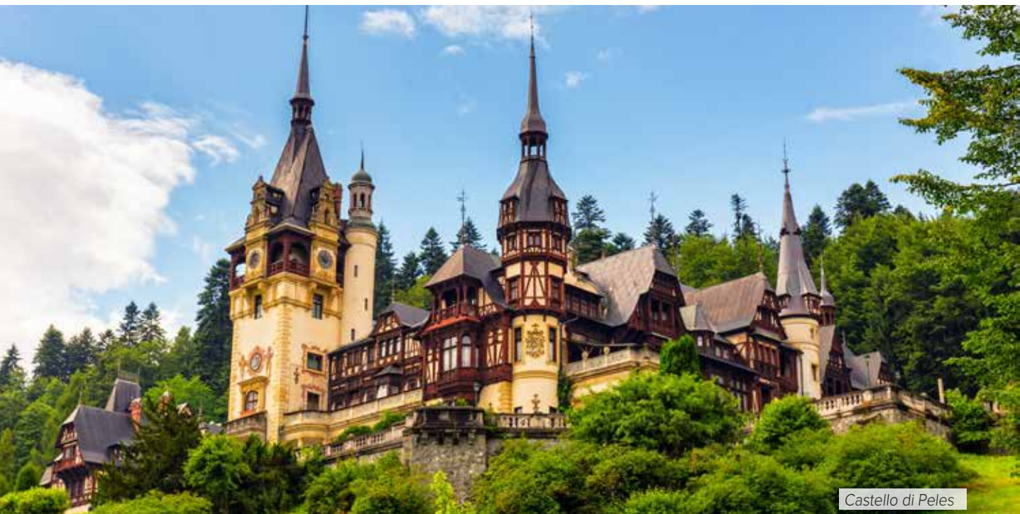
Castello di Peles

Prima colazione in hotel. In mattinata partenza per la Bucovina , la regione dove si trovano i famosi monasteri affrescati. Durante il percorso si attraverserà il famoso Passo Tihuta , dove venne girato il film "Dracula". Pranzo in ristorante. Nel tardo pomeriggio visita del Monastero Voronet , considerato