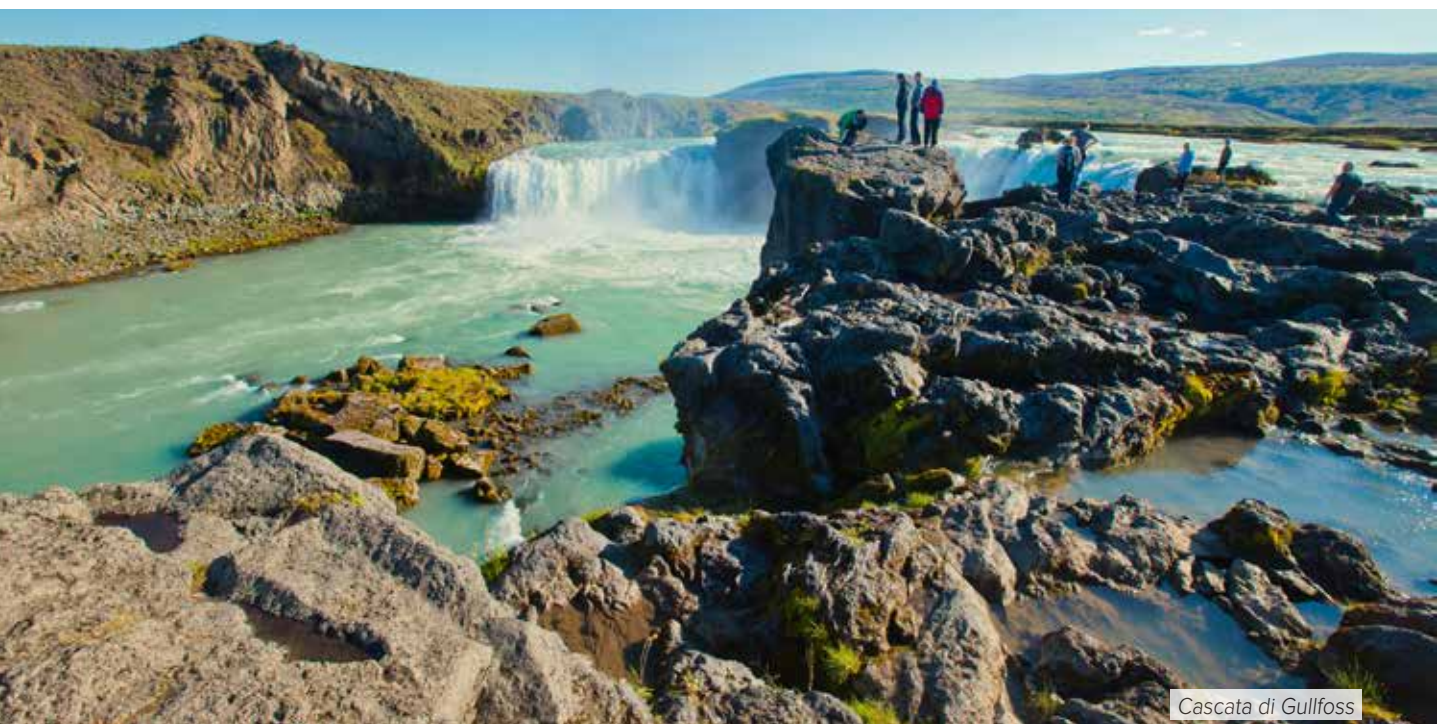
Cascata di Gullfoss

Prima colazione in hotel. Partenza per la fattoria-museo di Glaumber , dove si potranno ammirare le costruzioni e le attività tipiche dell'Islanda di un tempo. Continuazione per Siglufjörður per la visita del Museo dell'Aringa dove si potranno scoprire le tecniche di pesca e lavorazione di questa importante risorsa islandese e per una degustazione. Pranzo libero. Proseguimento per Dalvík , un villaggio di pescatori di circa 1900 abitanti, posto sull'Eyjafjörður non lontano da Akureyri. Imbarco per effettuare un'escursione in barca per l' avvistamento delle balene , un'esperienza davvero unica. Al termine sistemazione in hotel nell'area di Dalvík/ Akureyri. Cena e pernottamento.